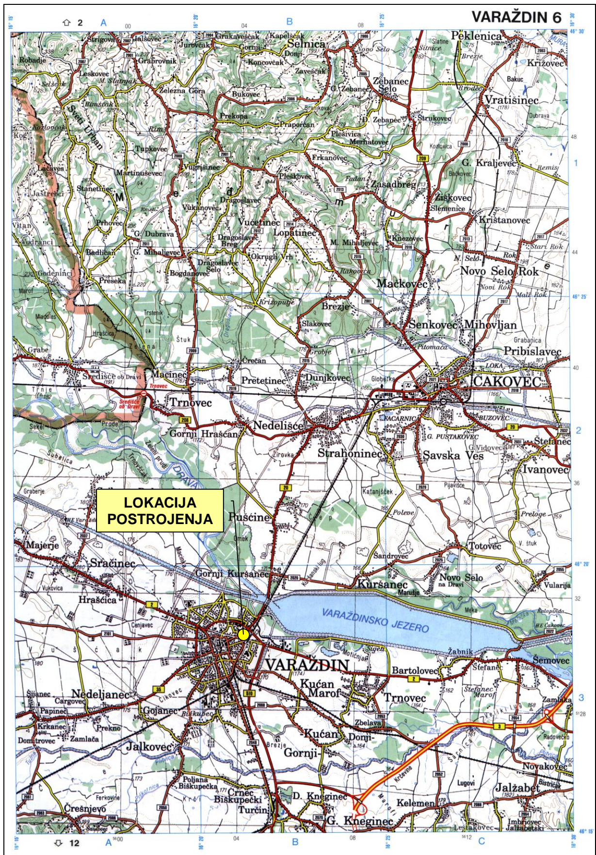
Prilog 1. Zemljopisni položaj lokacije postrojenja.